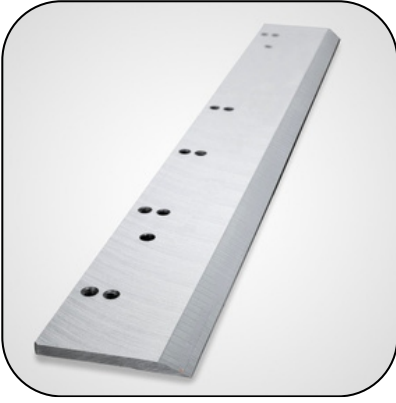
Düz / Lama Bıçaklar