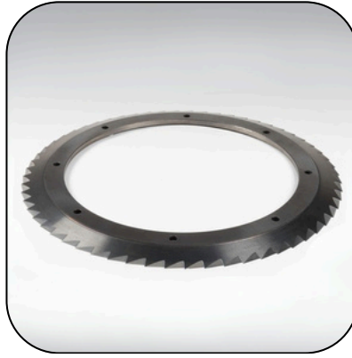
Hareketli Kağıt Kesici Bıçakları