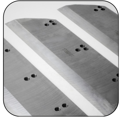
3'lü Trimmer Bıçakları