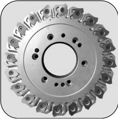
Kitap Sırtı Kesim Bıçaklar

Geniş düz bıçakların yanında, kitap sırtı kesim bıçağı ve dairesel bıçaklar da sunuyoruz. Standart ürünlerin yanında, size ve isteđinize özel üretimlerle müşterilerimize yardımcı oluyoruz. Bıçak ve kesicilerden daha fazlasını mı talep ediyorsunuz? Size yardımcı olabiliriz. En uygun maliyetlerde komple bir grafik ve ambalaj çözümlerini siz müşterilerimizle buluşturuyoruz.